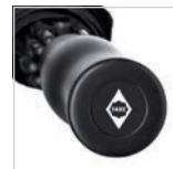
Griff mit Werbeanbringungs-möglichkeit