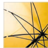
Windproof-System mit Fibertec®-Schienenkonstruktion