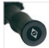
Griff mit Werbeanbringungsmöglichkeit