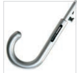
Silberner Soft-Touch-Griff mit Werbeanbringungs-möglichkeit