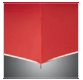
Silberne Reflexpaspel (gem. EN ISO 20471)