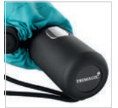
Soft-Touch-Griff mit Werbeanbringungsmöglichkeit