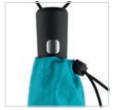
Griff mit verchromter Auslösetaste