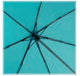
Windproof-System mit Fibertec®-Schienenkonstruktion