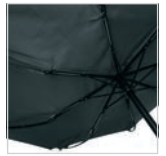
Windproof-System mit FARE®-FlexBar Kunststoffschienen