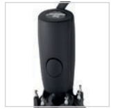
Soft-Touch-Griff mit Auslösetaste und Werbeanbringungsmöglichkeit