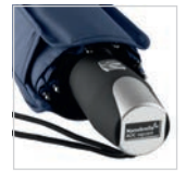
Soft-Touch-Griff mit Auslösetaste und Werbeanbringungsmöglichkeit