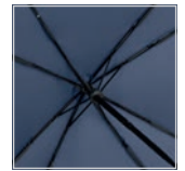
Windproof-System mit FARE®-FlexBar Kunststoffschienen