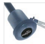
Transluzenter Griff in Titanfinish mit Werbeanbringungsmöglichkeit