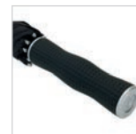
Exklusiver Griff in besonderem Golf-Design mit Werbeanbringungsmöglichkeit